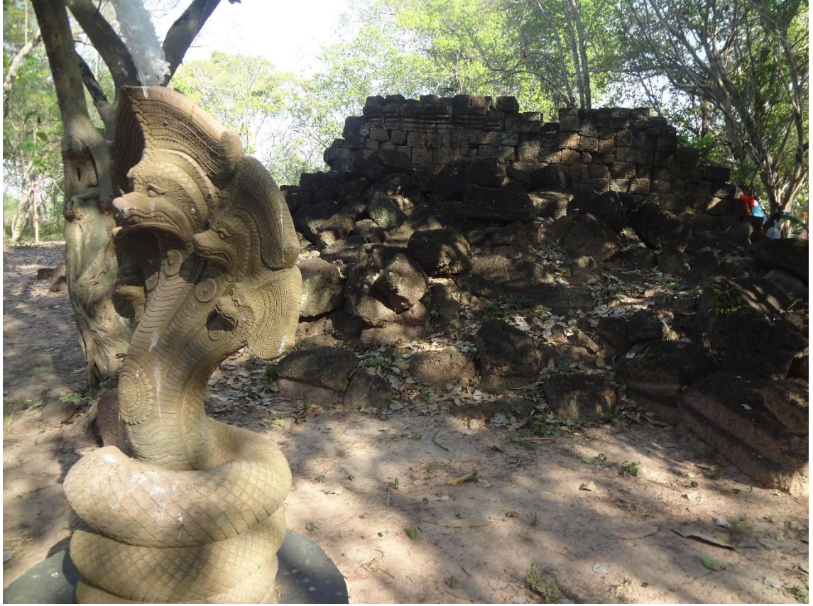
: ภาพบริเวณโดยรอบตัวปราสาท